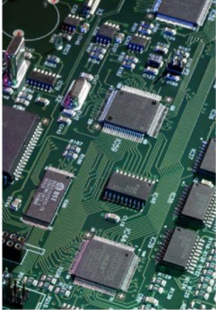
DICOEL dissenya i fabrica components electrònics de tot tipus.

Tradicionalment, DICOEL ha defugit l'electrònica de consum, els grans volums de producció i els marges reduïts. La recerca de mercats amb un valor afegit superior ha dut l'empresa barcelonina a especialitzar-se en l'electrònica industrial i, actualment, els productes de DICOEL poden trobar-se muntats en àmbits molt diferents: aparells d'electromedicina, maquinària per a l'alimentació, màquina eina, equipament per a laboratori, pesatge i embalatge, ferrocarril, domòtica... DICOEL disposa de la certificació ISO 9001 des del 1995 i, atès el notable pes específic que representen les comandes destinades al sector mèdic, disposa de la certificació ISO 13485 de qualitat de producte sanitari.